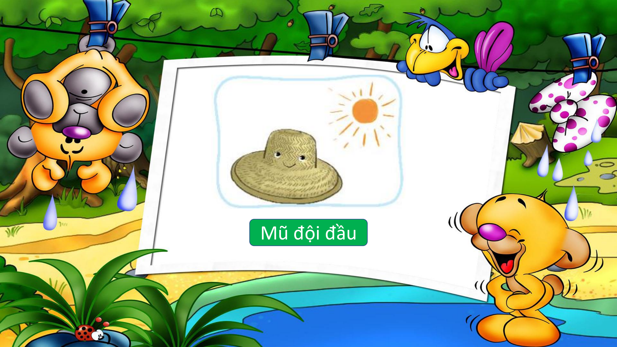
Mũ đội đầu