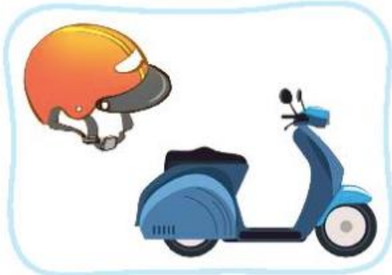
Mũ bảo hiểm