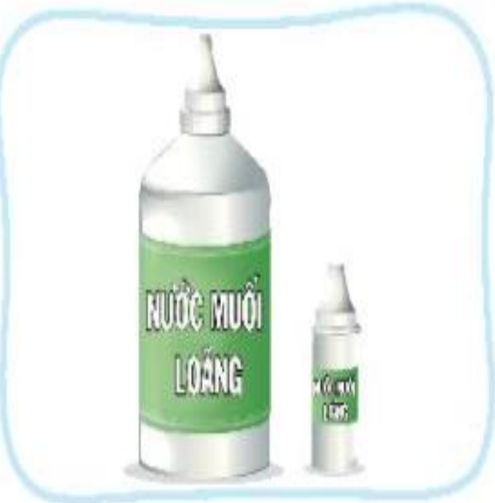
Nước muối sinh lý